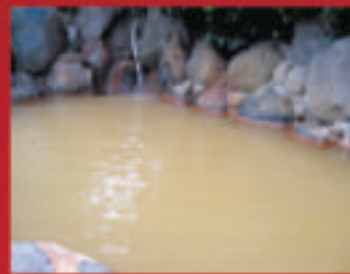
長山旅館 TEL 0920-43-0033