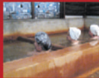
旅館千石荘 TEL 0920-43-0004