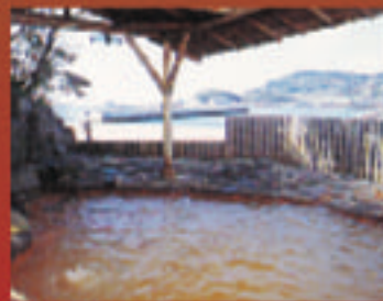
旅館海走館 TEL 0920-43-0012