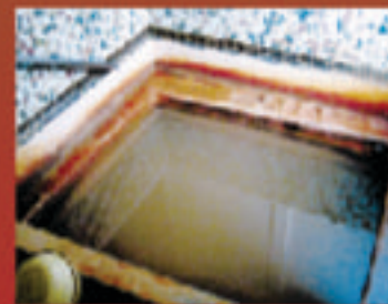
あづまや旅館 TEL 0920-43-0006