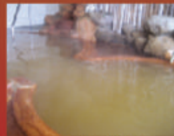
国民宿舎壱岐島荘 TEL 0920-43-0124