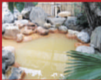
平山旅館 TEL 0920-43-0016